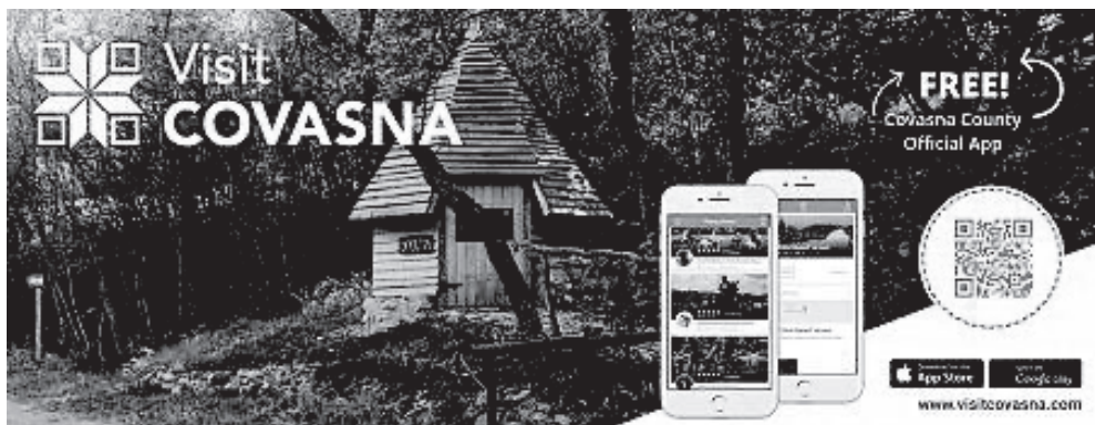
5. ábra: Visit Covasna applikáció – online reklámbanner