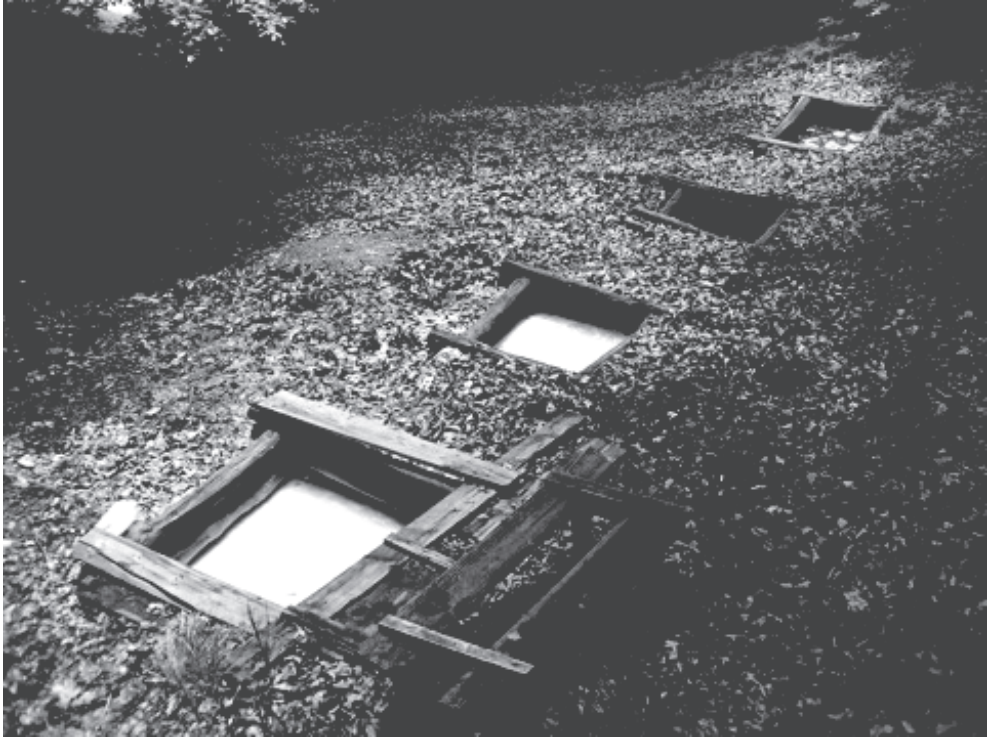
4. ábra: Borvízforrások Háromszéken